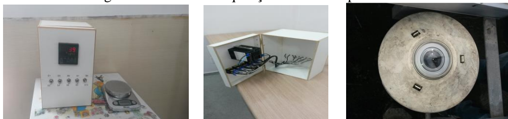
Figura 3. Sistema de aquisição de dados e piranômetro.

RESULTADOS E DISCUSSÕES. A Figura 4 mostra a distribuição de temperatura do ar de secagem no coletor solar e na câmara de secagem e a variação de massa das bananas.