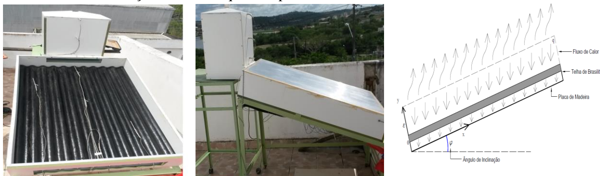
Figura 1. Fotos do Sistema de Secagem Solar no solarium do LEMT/UFCG, com destaque para placa adsorvedora da radiação solar e o esquema representativo da transferência de calor no coletor solar.

Muitos autores observaram que a equação de Fick apresenta grandes limitações, quer seja pela necessidade de um grande número de termos quer seja por não representar os dados experimentais em trechos das curvas. Dessa forma, para estudar a cinética de secagem e a significância estatística, foram utilizados os modelos de Page e Mata, que segundo os autores, Nunes et al. , (2014) proporciona melhor adequação no processo de secagem de frutas em camadas finas. As equações representativas dos modelos de Page e Mata estão apresentadas nas Equações 1 e 2.