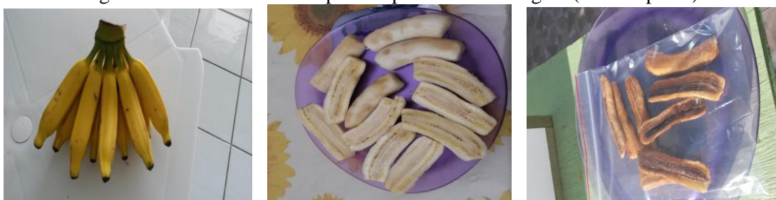
Figura 2. Bananas antes e depois do processo de secagem (banana-passa).

Para medições das propriedades do ar de secagem (temperatura, umidade e velocidade) foram utilizados um Termo-Higrômetro (modelo HT-208 da ICEL), e um anemômetro digital portátil (modelo GM 8901). Para medir a variação de massa da banana durante a secagem foi utilizada uma balança de precisão de 5 kg (modelo KC-01 da Western, com precisão de 1 g).